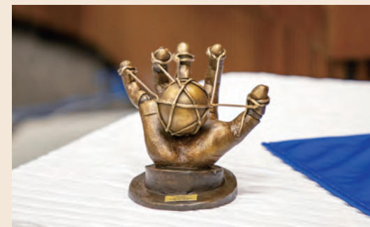
AVIAMA賞の受賞者に贈呈されるトロフィー

今後も人形劇を通じた世界のネットワークが大きくなって、人形劇界がさらに発展していくことを期待しています。