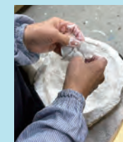
2日目は石膏の型に和紙を張り重ねます