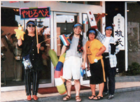
シルクホテル玄関前にて(1998年)。写真左が筆者

1979年にスタートした「人形劇カーニバル飯田」に初めて参加したのは、1982年でした。ワッペンを付けていれどこの会場もフリーパス。大人も子どももキラキラ輝いて見えました。翌年からは、研修と称して、人形劇の仲間とともに飯田詣りが始まりまして。 連日、プロの劇団や、アマチュア劇団の