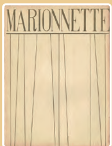
MARIONETTE Vol. II-1 郷土演劇協会(1931年5月28日)