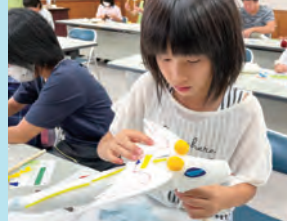
細かいところまでこだわって完成をめざします