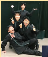
仲間たちと (写真左から2番目が筆者)

※いいだ人形劇センターが取り組む「人形たちとつくるコミュニティスポット ほっこり」の活動は4面に掲載しています。