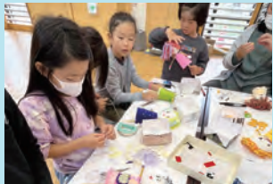
目や口、洋服はフェルトや毛糸で飾り付けます