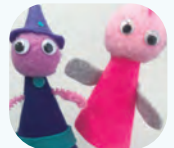
フェルトのちびっこ人形

誌面に掲載したほかにプログラムがあります。図書館や公民館、認定こども園などさまざまなイベントでモノづくりの楽しさを体験しませんか。なんでもご相談ください。