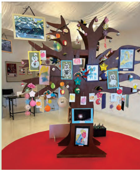
「アートの実」がたくさん実りました