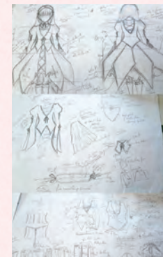
コスプレ手作り用のプラン

あの機会では色々な人と会えて大好きなキャラクターの話ができて本当にうれしかったです。