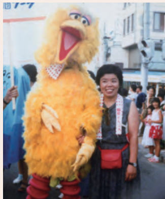
わいわいパレードの行進が始まる前に「ビッグバード」と記念撮影

方々に依る人形劇を堪能して考えたことは、「地元でも人形劇フェスを立ち上げよう!」でした。