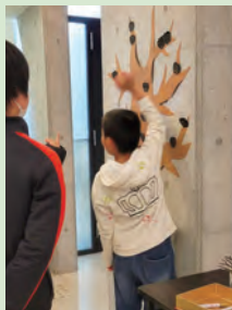
観賞した方も展示に参加。りんごの形をした紙にメッセージを書いた壁面の木に実らせました