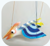
はばたくマリオネット