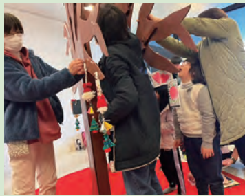
「丘のりんご」の仲間たちが作品を持ち寄って飾り付けをしました

※いいだ人形劇センターが取り組む「人形たちとつくるコミュニティスポット ほっこり」の活動は4面に掲載しています。