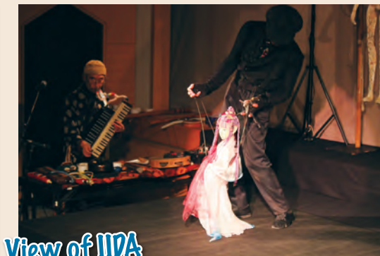
View of IIDA

新春恒例の公演「初春を寿ぐ竹田人形館」は4年ぶりに会場を竹田人形館に戻して開催され、かわせみ座によるマリオネットと、夏秋文彦さんが奏する鍵盤ハーモニカやさまざまな楽器の演奏とのセッションを楽しみました。