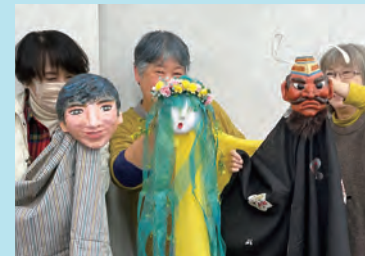
張り子に彩色や装飾を施して完成しました