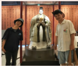
川本喜八郎人形美術館にて