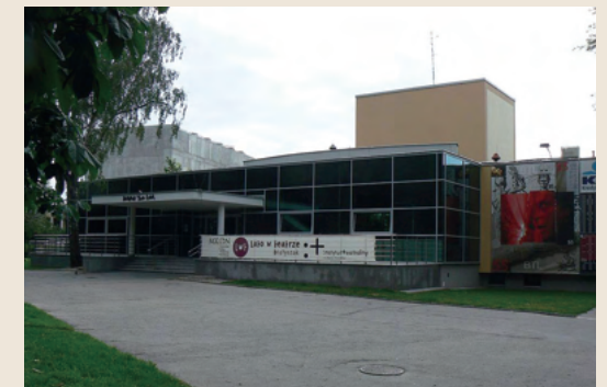
ビアウィストック人形劇場

また、多くの歴史的建造物、医科・技術・教員養成の各大学や博物館を持つ文教都市として知られており、演劇学校には名門と呼ばれる人形劇部門もあります。ビアウィストックの人形劇はポーランドでも最も古い人形劇の1つで、1953年に設立されたビアウィストック人形劇場では、子ども向けの作品はもちろん、大人向けの作品も上演されてきました。上演される作品は芸術的にレベルが高く、この劇場はポーランドで最高の人形劇センターの1つに数えられています。