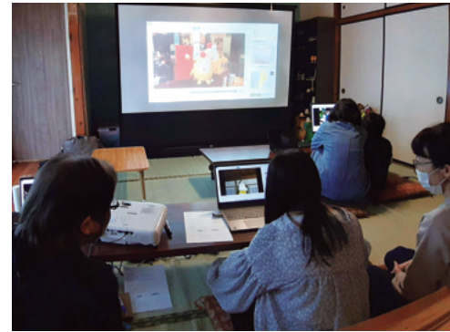
編集ソフトを使ってパソコンで作業中