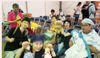
“わいわいパレード”に参加した仲間たち

な、わくわく笑顔で溢れている!それから京都でツアーを企画したことも。私達は毎年とはいきませんでしたが、転動しながらもその町の人形劇団の方に「飯田に行きましょう!」と誘って、我が子も一緒に出掛けた事もありました。公民館に泊まり、子ども達は学生サークルの皆さんに遊んでもらったりお世話になりました。今でも人形劇だけでなく、観光や美味しい物を食べたり。いつでも人形劇の仲間や町の方々が「○○行つといで〜」と教えてくださいます。人形劇を真ん中にして笑顔繋がる町飯田でいっぱいいっぱい「嬉しい!」をまた体感しに行けることを心待ちにしている毎日です。