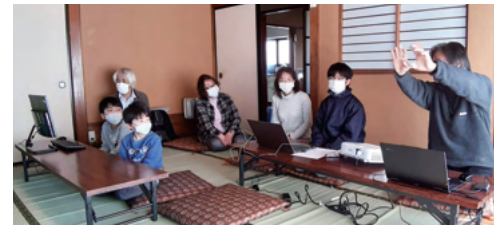
動画づくりに必要なことを聞きます

ほっこりは昨年から始まった人形劇を通じた居場所づくりです。といっても、このコロナ禍では「密になりやすい人形劇づくりはちょっとなあ」と思っています。飯田では感染者も落ち着いていますので、地元を中心に感染防止対策をしながら一緒に始めてみませんか。 おうち時間が増えるなかで、ご存じのようにさまざまな動画を見る機会や動画をつくって投稿する人たちがかなり増えています。でもどうやって動画を作ればいいんだろう?という人もいます。そこで、特に子どもたちにコロナ禍