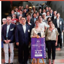
今年の総会開催を期に、雲林県、春川市、セビリア、南あわじ市の4都市が新たに加盟

いいだ人形劇フェスタのインフォメーションを訪ね、案内役の「ペッパー」に話しかけるボリス・ラヴィニョン市長