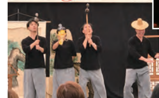
アジア、ヨーロッパ、アフリカなど世界の六大州から飯田へ。多種多様な作品が上演された