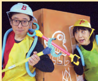
現在上演中の作品より「キナコちゃん和ダンス」(写真左)、「ぼく、ピンチなんです」

時折ワークショップでスポンジ人形を作ったり動かして遊んだり、作品上演に向けた事前座談会でお話をさせてもらう事もあります。忙しい時は忙しく、暇な時は暇。メリハリのある日々です。