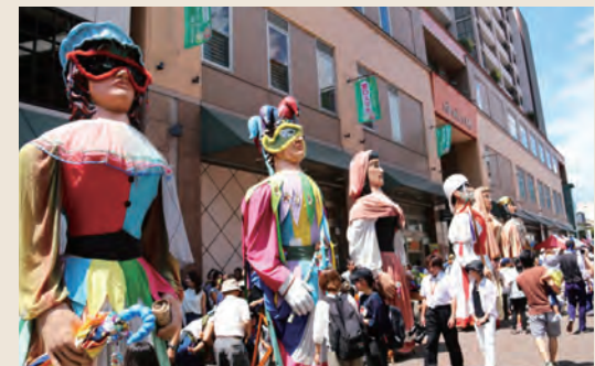
本町の歩行者天国に現れた「巨人」たち。陽気で軽快ながら大迫力のパフォーマンスを披露しました

手法も雰囲気も全く異なる、それぞれの地域に特有の人形文化。人形劇との出会いをきっかけに、世界のことをもっと知りたい!と思う人が増えると嬉しいです。