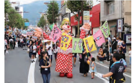
国内外の劇団が人形を手にパフォーマンス(わいわいパレード)