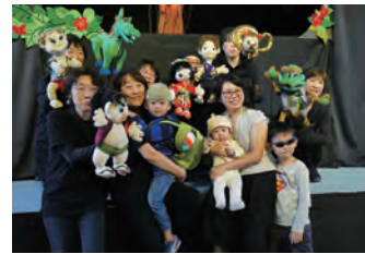
上演後はお客さんたちと記念撮影。子どもだけでなく大人も列を作って順番待ち