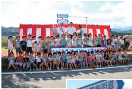
龍江地区「天竜峡桜街道」で行われた「シャルルヴィル・メジール通り」の命名式