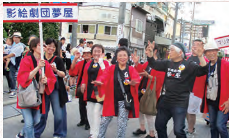
わいわいパレードに参加

「お母さん人形劇」のブームに乗って子育て中に始めた「人形劇」にどっぷりつかって五十年になります。「飯田」へは、観劇参加から始めました。涼しい信州と思った飯田の暑かったこと！ですが、それ以上に飯田は熱かったです。