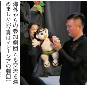
海外からの参加劇団とも交流を深めました(写真はマレーシアの劇団)