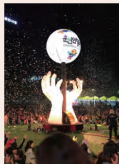
春川市庁舎前の広場で行われた30周年記念のオープニングセレモニー

春川人形劇祭とは、フェスタ10周年の2008年に、台湾の雲林フェスタも含めて、東アジア三天人形劇祭として友好提携を結び、劇団の紹介や派遣、スタッフの相互訪問などを通じて交流を深めています。今年で春川フェスタは30周年。今回の訪問