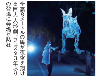
全高8メートルの馬が夜空を翔ける巨大人形劇。フェスタ3年ぶりの登壇に会場が執狂