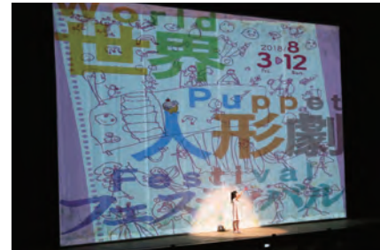
今年のポスターの絵を描いた飯田市内の小学校1年生の「お絵かき」で開幕(オープニングセレモニー)