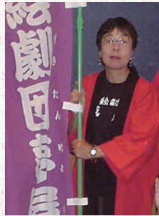
いい大人形劇フェスタに10回以上参加した劇団がいただける顕彰旗をいただきました