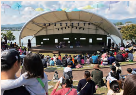
人形劇場敷地内の屋外ステージでは朝から夜まで公演が行われ、多くの市民が観劇していました