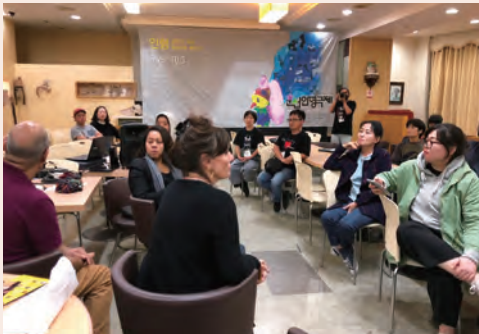
韓国の劇団との交流会。各劇団のプレゼンテーションを見せていただき、いくつかの劇団とお話できました。フェスタに呼びたい劇団もいくつか