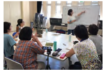
台湾公演用に台本を中国語に書き直し。中国語の語学レッスンも行いました